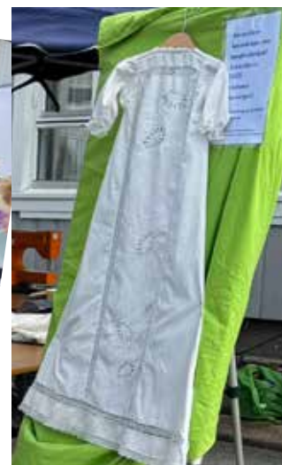
Nydelig dåpskjole av en blondeduk og laken. Sydd av Gunnhild Øye Løken for å vise gjenbrukspotensiale.