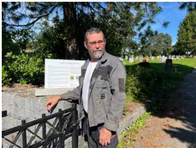
INFORMASJON: Gamle plakater på nye steder kan hjelpe de pårørende på Ås med å holde seg orienterte om hvilke regler som gjelder på kirkegården.