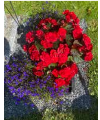
BLOMSTERPRAKT: Slik kan en grav se ut når pyntingen er satt bort til kirkens ansatte.