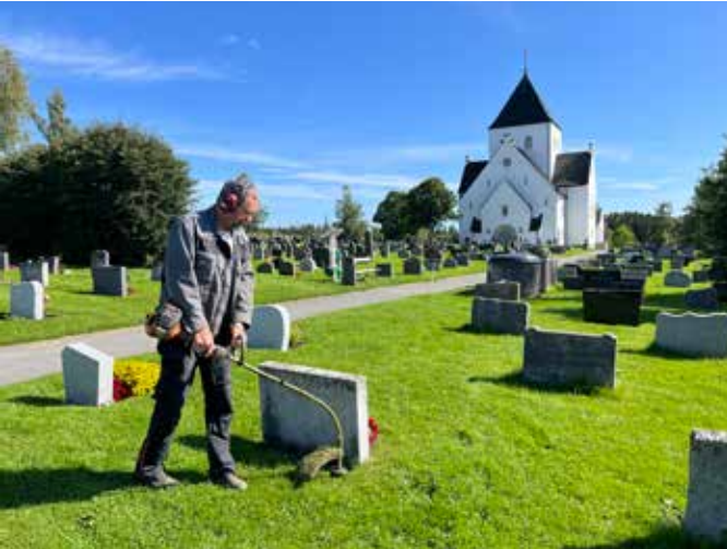
VELSTELT: De ansatte er kjent for å holde det pent på kirkegårdene i Vestre Toten. Kantklipping rundt gravminnene er «kronen på verket».