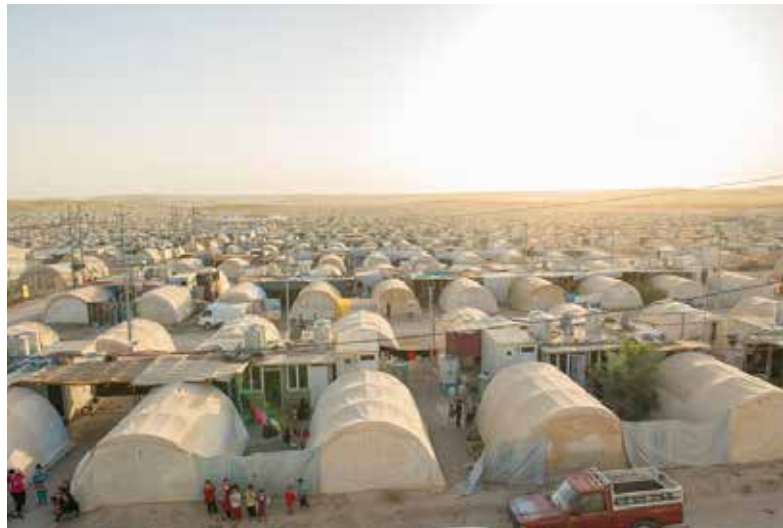
28 000 mennesker lever sitt hverdagsliv i denne flyktningleiren i Kabarto hvor Kirkens Nødhjelp sikrer rent vann og gode sanitær løsninger.

I julen feirer vi Jesus som ble født i en stall for 2000 år siden. Denne julen vil våre menigheter i Vestre Toten også minne om barna som fødes inn i vår verden i dag – i fattige land som Malawi og Etiopia, eller på flukt fra krig og lidelse i Syria og Nord-Irak. Dersom du tenker deg på julegudstjenesten, håper vi du vil gi en gave til arbeidet vi gjør sammen med Kirkens Nødhjelp. Husk å ta med kontanter til kollekten. La flere fylle fem!