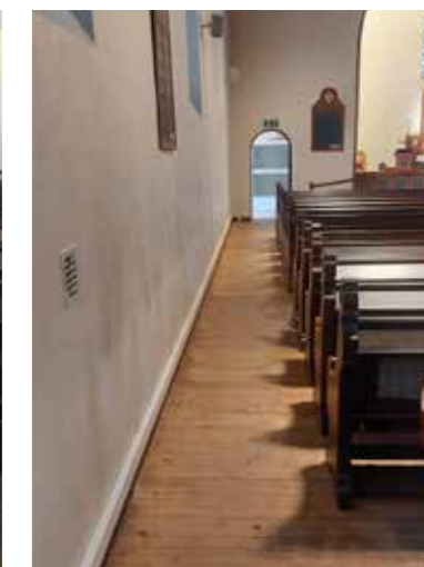
Bilder før og etter. Det gjenstår å male over sotmerker etter panelovnene.