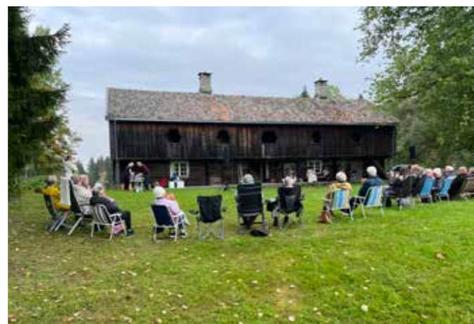
FØR REGNET: Ustabilt vær og løfte om mer regn stoppet ikke denne forsamlingen.