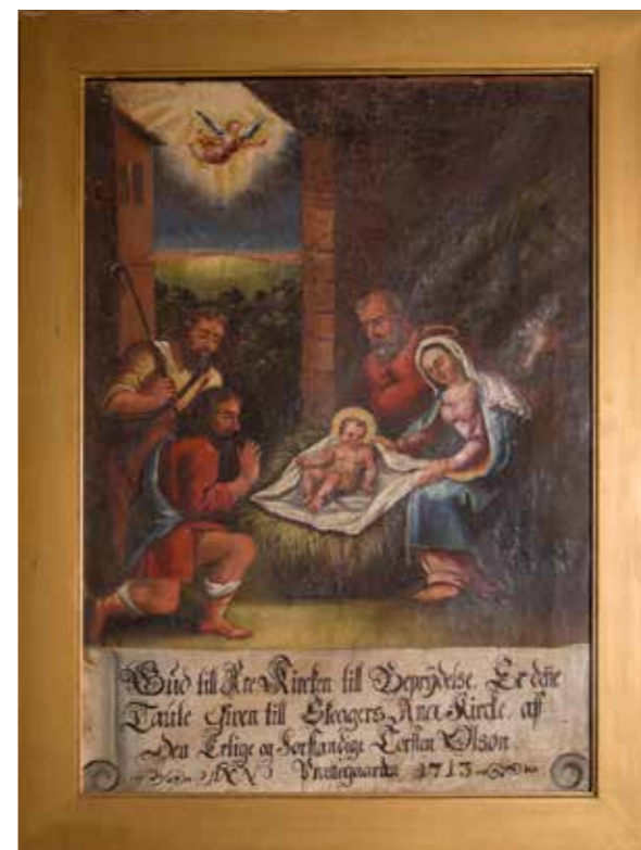
Maleri fra Skjåk kyrkje

Ordet skapte lyset i skapelsens morgen. Gud sa: «Det bli lys.» Og det ble lys! Dette Ordet fødes på ny og blir lys som lyser i mørket, ja, som lyser for hvert menneske. På denne måten åpner Johannes sitt evangelium. I kunsten kommer dette til uttrykk i malerier av Jesu fødsel. Det finnes ikke noe lys i stallen. Men lyset i maleriet stråler ut fra barnet. Og det er dette lyset som kaster lys på alle de andre i stal-