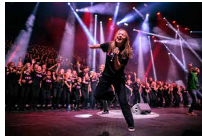
Fra tidligere års Soul Children festival i Oslo Spektrum

Du får være med i et musikalsk fellesskap med høy kvalitet, dedikerte dirigenter og godt fellesskap. Opplev gleden ved å synge flerstemt og oppdage ulike måter å bruke stemmen din. Stilen er som Soul Children på Spotify: Fengende soul, gospel og pop.