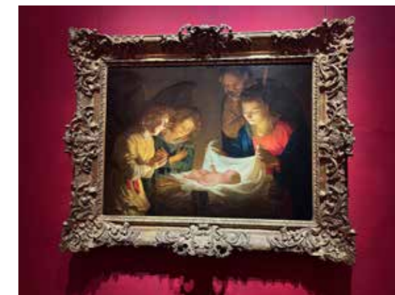
Adoration of the Child av Gerrit van Honthorst av fotografert fra Uffizigalleriet i Firenze

len. På stolte og slitne foreldre. På fattige og litt forskremte gjeterne. På dyr og detaljer i rommet. Det lyser på alt det skapte, og skaper ny virkelighet. Dette er kunstens tolkning av virkeligheten som skapes i Jesu fødsel og i Guds komme til verden. «Det som ble til i ham, var liv, og livet var menneskenes lys. Lyset skinner i mørket, og mørket har ikke overvunnet det.»