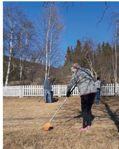
God teknikk med riva.