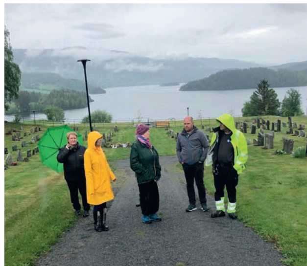
Nederst på kyrkjegarden i Lomen ligg den nye gravplassen.