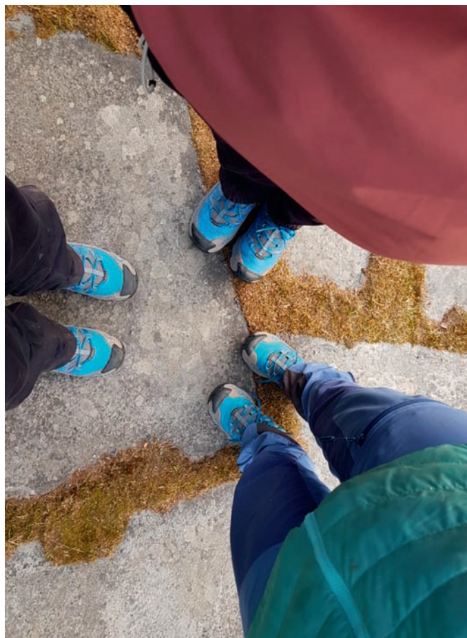
Ikkje planlagt, men tre soknerådsmedlemar hadde like sko til dugnaden!