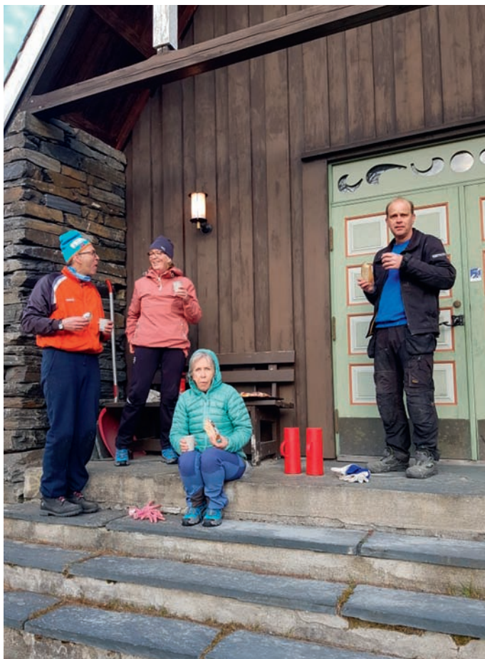
Å kvila på vegen gjev styrke i bein, og kan du so bør du det gjera. (Aa. O. Vinje)