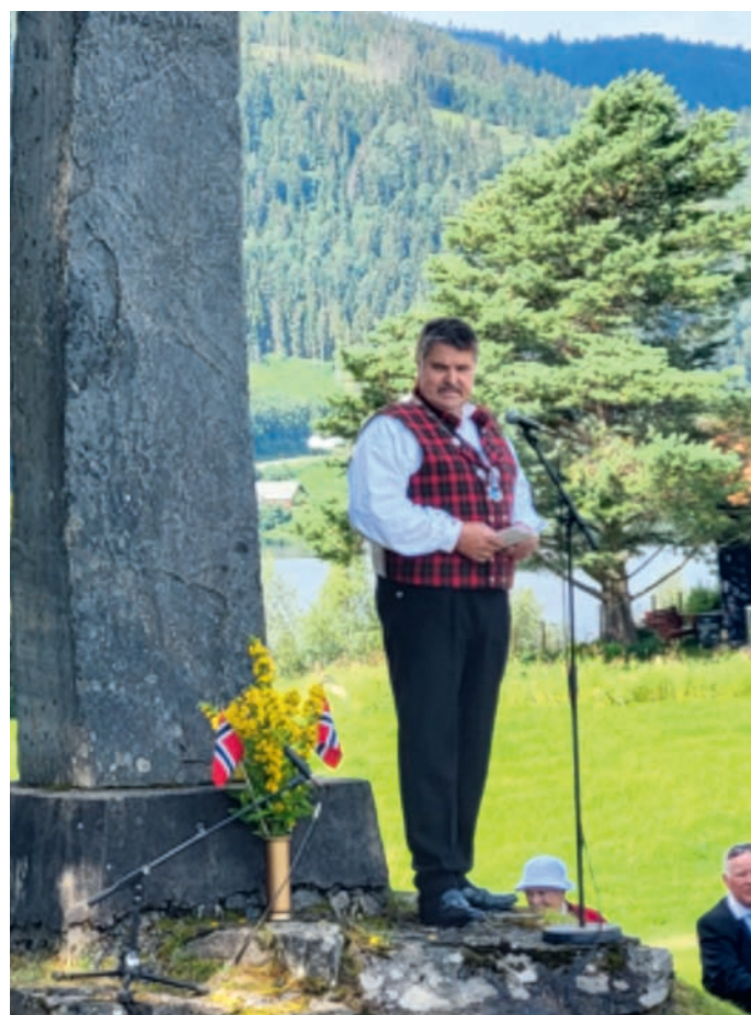
Haldor held god tale.

For ein dag, for ein fest! Taler, musikk og korsong, prosesjon med biskop i bispekåpe, prost og prestar, pilegrimar med tursko og vandringsstav, alle vanlege og uvanlege folk i flokk og fylgje, klokkinging frå kyrkjetårn og stupul. Økumenisk fredsgudsteneste, tekstar lesne på samisk, singhali, ukrainsk og norsk, framføring av Olavshymne med kor og handklokker,