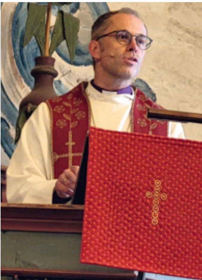
Biskopen på preikestolen.