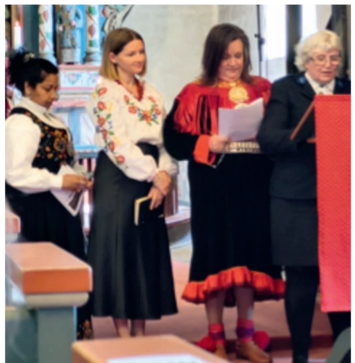
Fire forskjellige språk