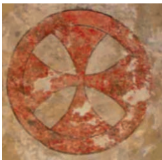
Innviingskross i Slidredomen.