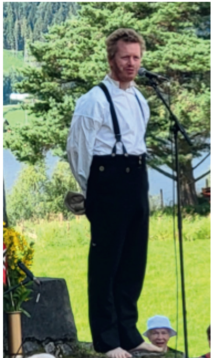
Ein berrføtt kar i bunad ...