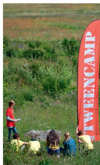
Under pilegrimsvandringa står leiarane på kva sin post og fortel om kvar si perle i ”Kristuskransen”.

ungdomane, kveldssamlingar i Slidredomen, grillfest med underhaldning i lavvo og bading ved Tingsteinen.