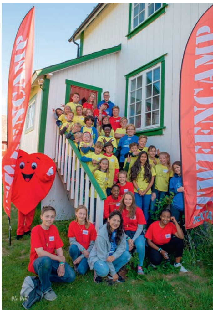
20 deltakarar var med på Tweencamp i år – og 12 unge leiarar.