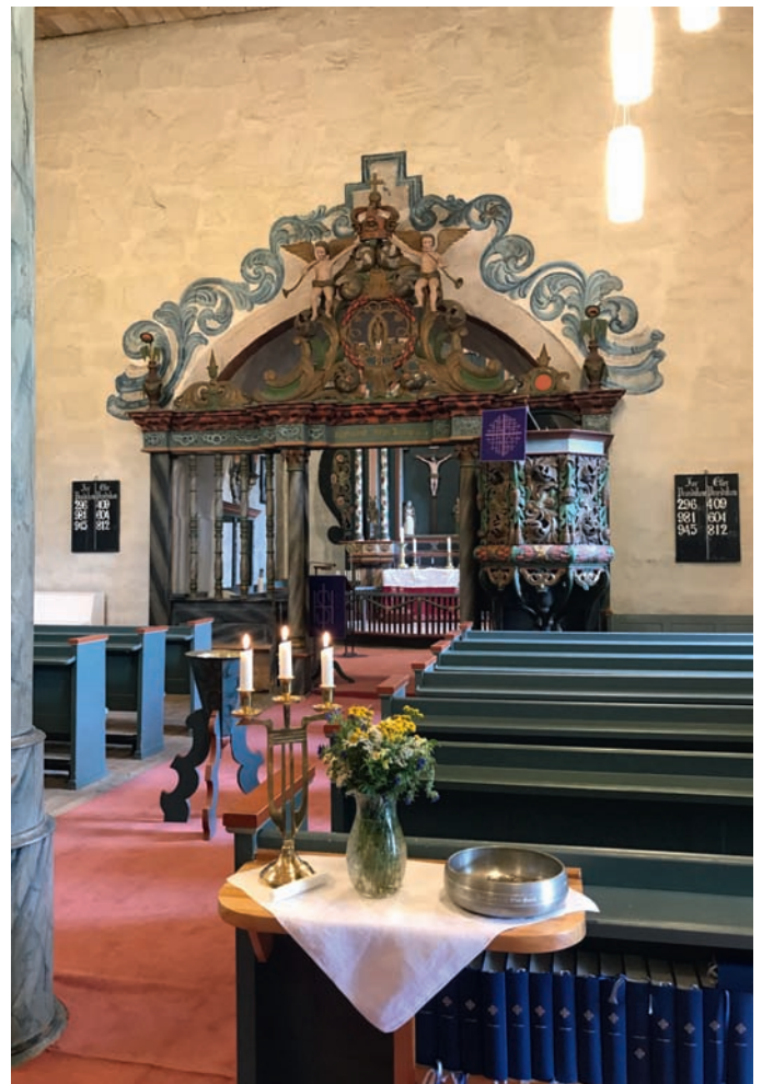
Ei open kyrkje ønske folk velkomne i sommar.

På lik linje med liturgien, vil også prestens preken ofte være gjenstand for oppmerksomhet og sterke meninger. Hva presten sier og ikke sier, kan ofte være helt avgjørende for hvordan gudstjenesteopplevelsen blir. Snakker presten et språk vi forstår? Er han inkluderende i språket, eller ekskluderende? Er det han sier relevant inn i vår hverdag? Kan vi lære noe av det han sier? Føler man seg oppbygd og inspirert