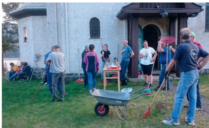
Bra oppmøte, og også tid til kaffepause, ved Lomen kyrkjegard.

Eit par veker før 17.mai låg det framleis store mengder med snø att etter den snørike vinteren. Vi var fleire som tenkte at snøen ikkje ville forsvinne på kyrkjegardane til grunnlovsdagen. Men så kom den gode varmen, som vi har hatt med oss gjennom heile sommaren, og snøen forsvann, og på alle kyrkjegardane blei det arrangert dugnadar. Det var bra oppmøte alle stadar – og kyrkjekontoret vil nytte høve til å takke alle som møtte opp!!