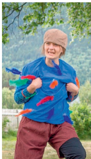
Goggen prøver å forklare korleis det er å vere Jesu venn, men det vert vanskeleg.