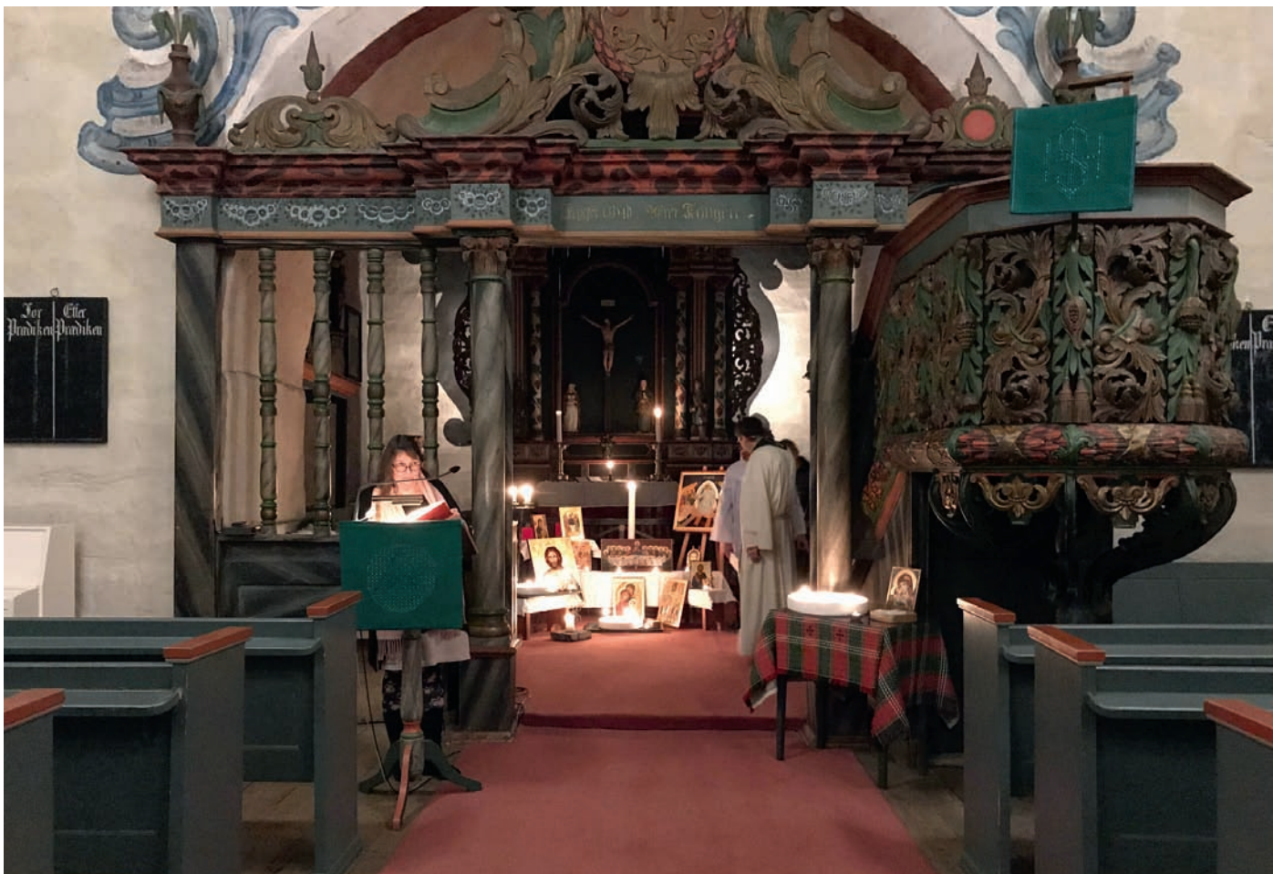
Folk vert ønske velkomne til Taizégudsteneste i ei nydeleg pynta kyrkje såmannssøndag 4. februar i år.

Til slutt vil spørsmålene omkring salmevalg og musikk bli drøftet. Det hadde vært fint om alle kunne tenke ut noen av sine «gode gamle» salmer som de savner og som de er glad i, i forkant av dette møtet, og så ser vi på dem i fellesskap. Under denne rubrikken vil det også være mulig å snakke litt om hva vi tenker om bruk av salmer i gudstjenesten, ulike sang- og salmetradisjoner, deres funksjon, og hva vi tenker omkring bruken av dem i våre messer.