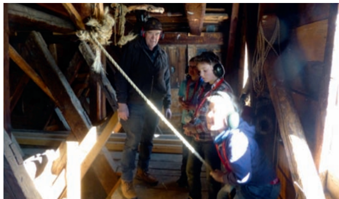
Tårnagentane synest det er moro å vere med Odd i klokketårnet.