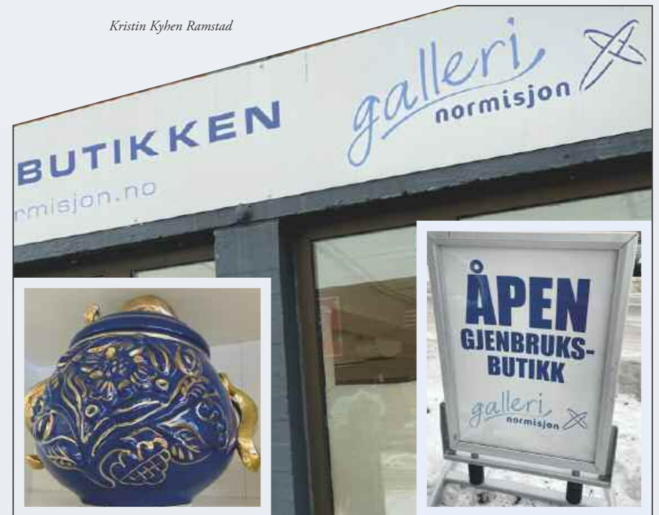
Velkommen til Galleri Normisjon er Normisjons gjenbruksvirksomhet på Sørumsand