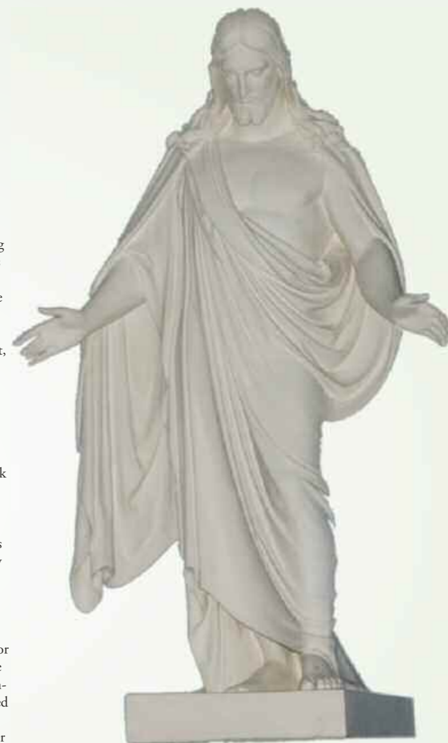
Den oppstandene Kristus, slik det er fremstilt i Dalen kirke, gir oss et håp om det evige liv.

Menneskelige håp har sin basis i det menneskelig mulige, og må forholde seg realistisk til den situasjonen