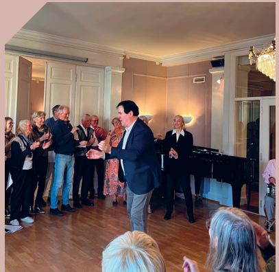
Fra arrangementer i Frogner kirke, fra kapellet, kirkestuen og Schafteløkken