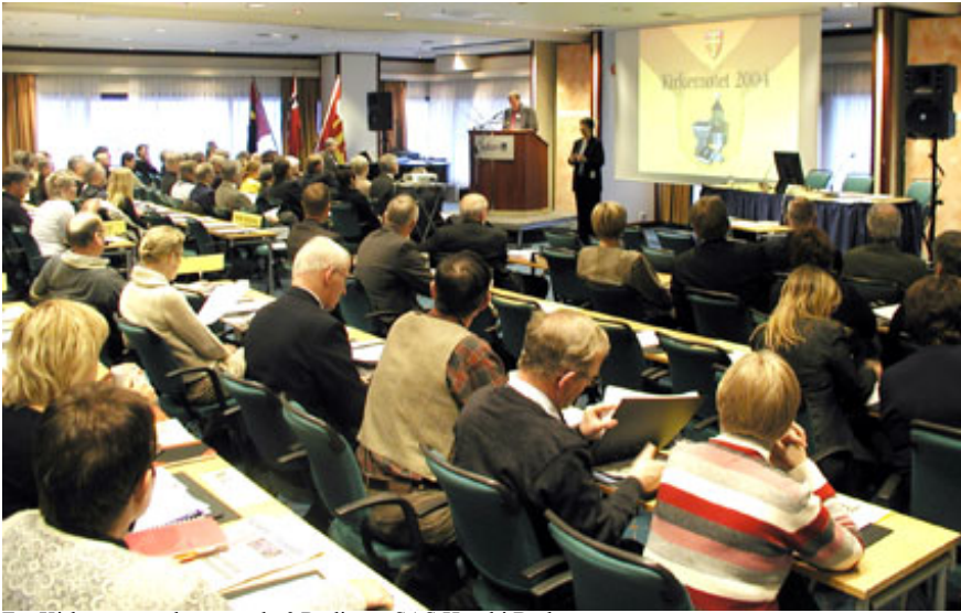
Fra Kirkemøtets plenumssal på Radisson SAS Hotel i Bodø.