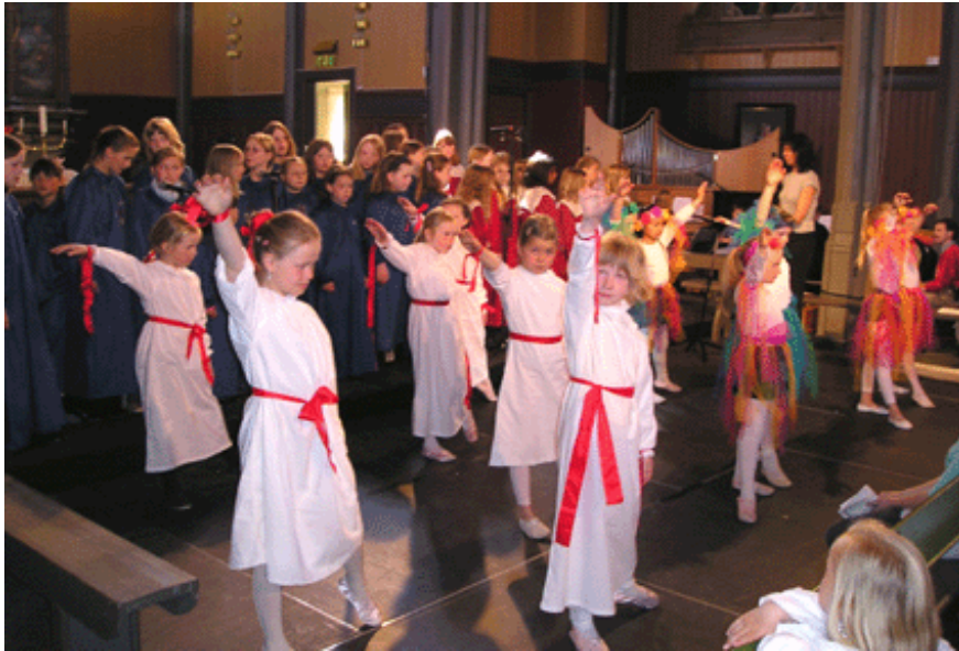
Barna hadde hovedrollen under storfamilesamlingen.