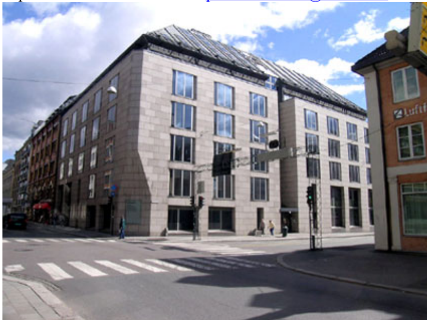
Kirkens hus blir fra 12. juli å finne her, i Rådhusgata 1-3, i Oslo sentrum.

E-postadressen er uforandret: post.kirkeradet@kirken.no