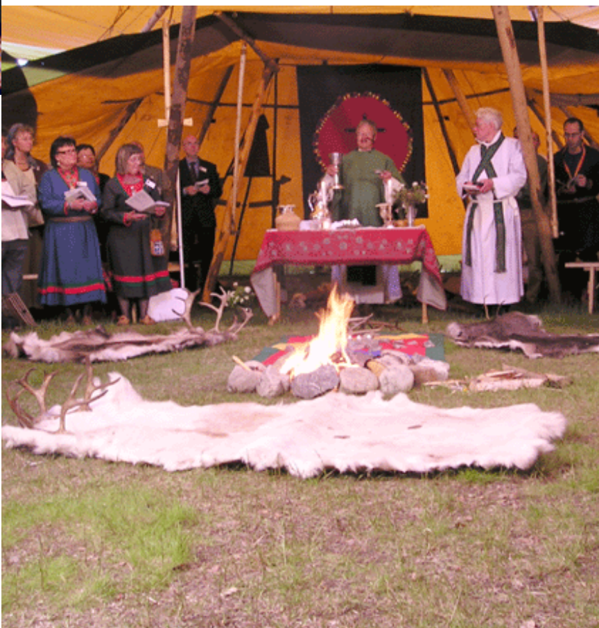
Prest for sørsamer, Bierna Bientie fra Snåsa, forrettet nattverden under åpningsgudstjenesten.

De første samiske kirkedagene teller 900 deltakere fra hele Sapmi (sameland). I tillegg kommer ikke-påmeldte besøkende. Omkring 200 påmeldte deltakere kommer fra den norske siden av grensen.