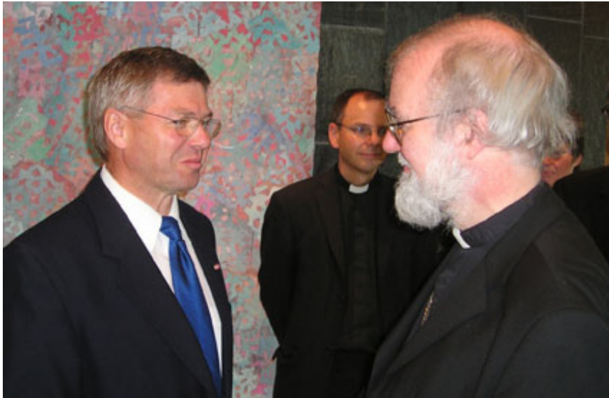
Statsminister Bondevik tok imot erkebiskop Williams på sitt kontor.