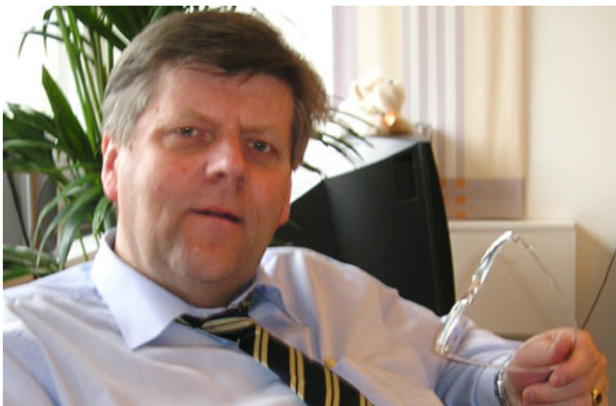
Statsråd Ansgar Gabrielsen iviterer til konferanse om kirken og helsetjenesten. Der vil kartleggingen av menighetsdiakonien bli presentert.

De to profilene som menighetene tillegger minst vekt, er den politiske- og nødsorienterte profilen som innebærer en vektlegging av krise- og nødsarbeid på den ene siden, og internasjonalt politisk arbeid på den andre, og den institusjonsorienterte profilen som vektlegger det å drive institusjoner, gjerne i samarbeid med kommunen. Selv om menighetene gir uttrykk for at disse profilene har liten vekt, viser det seg likevel at de i praksis har stor plass i menighetsarbeidet, ikke minst gjelder det nødsorientert virksomhet.