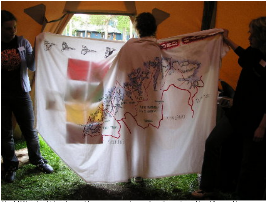
Nord-Hålogaland bispedømme ble presentert ved en ny form for stedegen bispekåpe med kart.

Pressekontakt fram til lørdag: Vidar Kristensen, Kirkens informasjonstjeneste, tlf. 95 77 75 25.