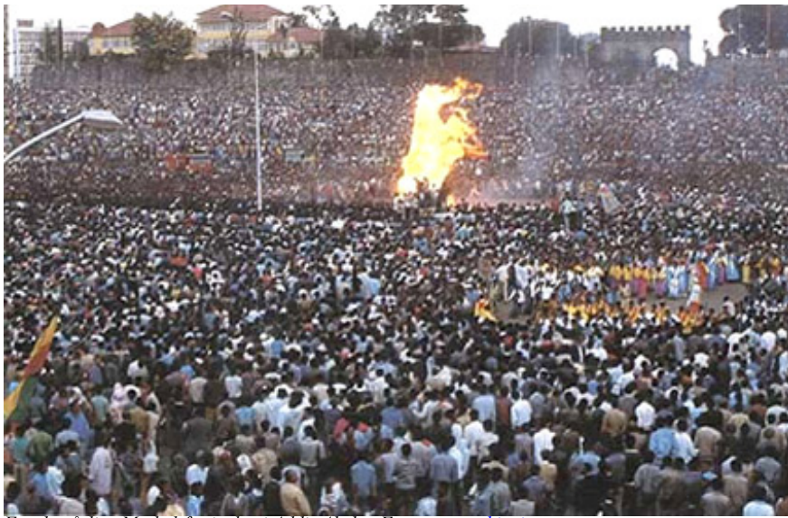
Fra den årlige Meskal-festivalen i Addis Abeba.