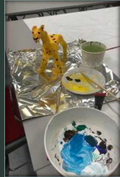
Estetisk kreativt arbeide mot Jul. Fuglemat for hagen og extended Julekrybbe