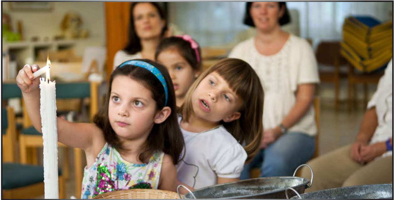
Barn tenner lys i sjømannskirken på Tenerife.

En egen medlemsmodul på intranettsiden «Min side» er under utvikling og rulles ut i løpet av 2013. Dette åpner mange nye muligheter for arbeidet med tilhørighet og engasjement for våre medlemmer.