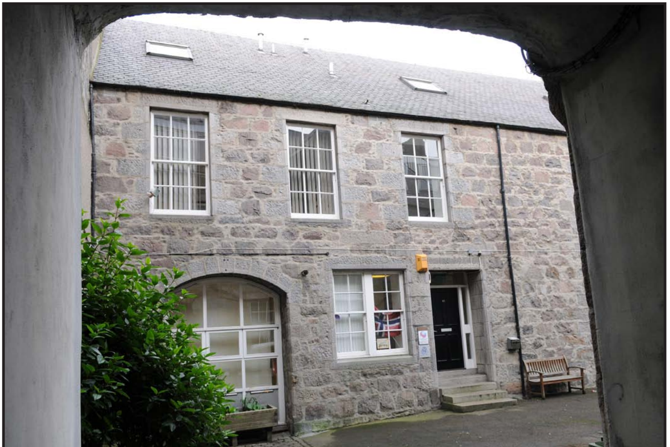
Den nye sjømannskirken i Aberdeen

Barn og unge er en av organisasjonens målgrupper. Situasjonen for barn som opplever omsorgssvikt har hatt særlig fokus i 2012. Dette er et område hvor Sjømannskirken mener det offentlige har et særlig finansieringsansvar. Generelt har Stortinget understreket voksnes ansvar for egen livssituasjon ved opphold i utlandet. Men når voksne ikke er i stand til å ta seg av sine barn kan man ikke basere seg på at vertslandet skal ta seg av norske barn som ofte kun snakker norsk og tilhører et miljø som har lite kontakt med lokale offentlige tjenester. Det er derfor gledelig at Stortinget gav en tilleggsbevilgning på kr. 1 360 000 med særlig tanke på arbeidet med barn ved behandlingen av statsbudsjettet for 2013. For øvrig understrekes at alt arbeid med norske barn i utlandet forholder seg til nasjonalt lovverk og ofte skjer i godt samarbeid med lokale myndigheter. Kartlegging av situasjonen for thai-norske barn, finansiert av prosjektmidler fra Barne-, likestillings- og integreringsdepartementet, ble igangsatt sommeren 2012 og avsluttes september 2013.