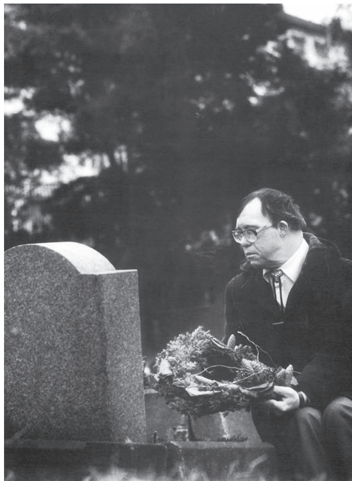
Fra «Bli kjent i kirken» IKO-Forlaget 2014.