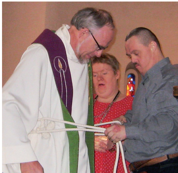
Prestens gode hjelpere i Gimsøy kirke i Skien.