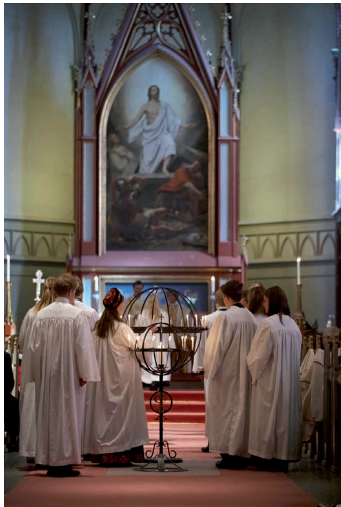
Konfirmasjon i Bragernes kirke, Drammen.