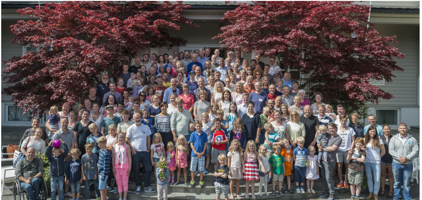
Noen av Sjømannskirkens ansatte med familier på Norgeskurs 2015.

Sjømannskirken skal være et sted hvor det er godt å bruke sin tid, sine krefter og sitt engasjement som ansatt og frivillig.