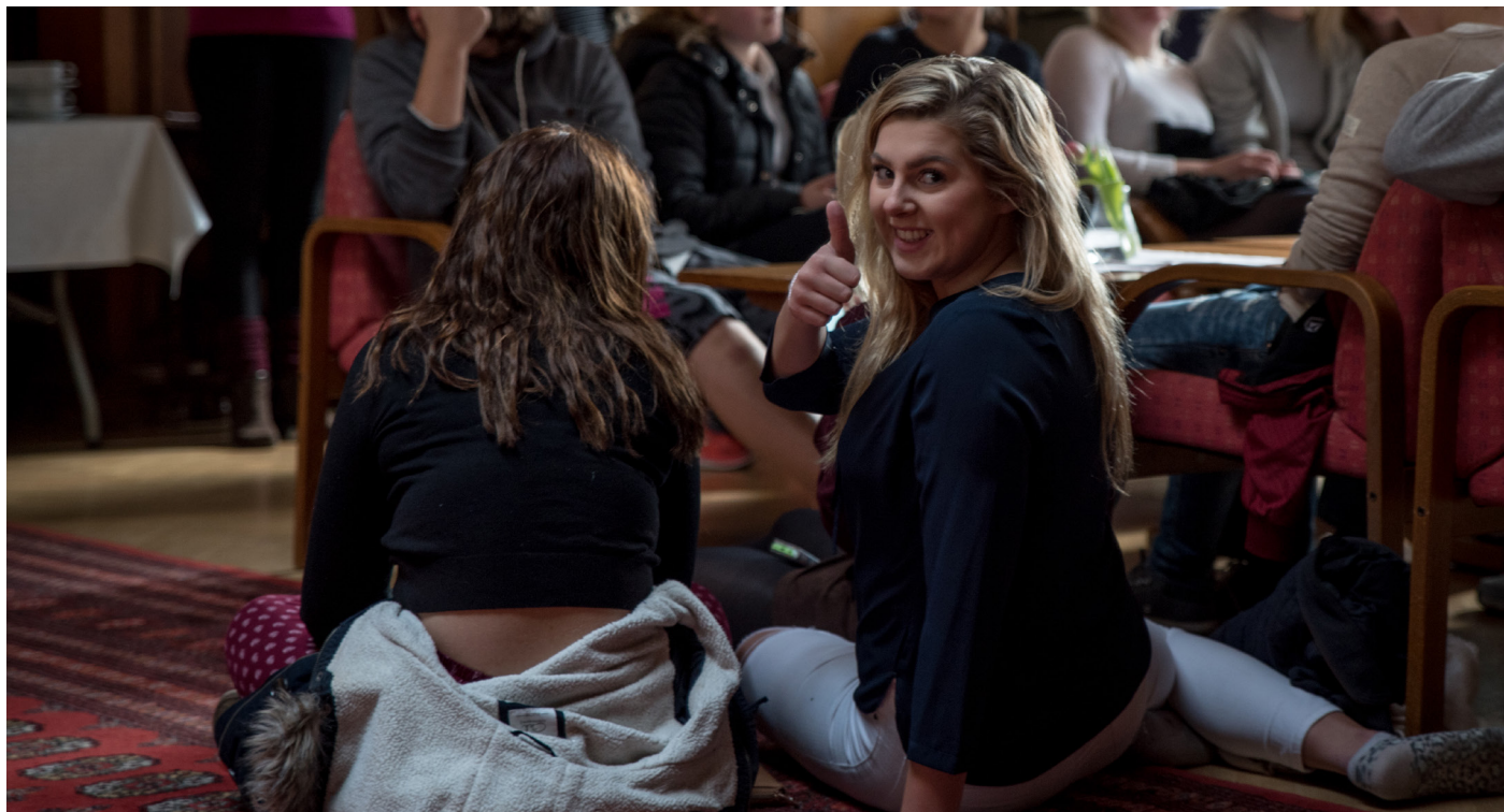
Konfirmanter på leir i Sjømannskirken i London.