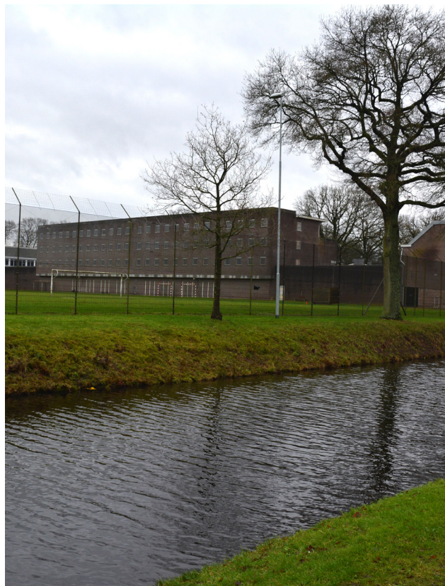
Norgerhaven fengsel i Nederland.

Kriminalomsorgsdirektoratet (KDI) har bevilget 145 500 kroner til sjømannskirkens besøkstjeneste overfor innsatte i fengslet. Sjømannskirken har overfor KDI skissert muligheten for en fast besøksordning, samt ulike kirkelige- og sosiale tiltak og samtalegrupper.