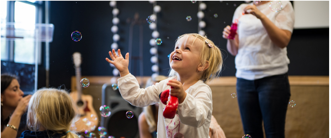
Småbarnstreff i Houston.