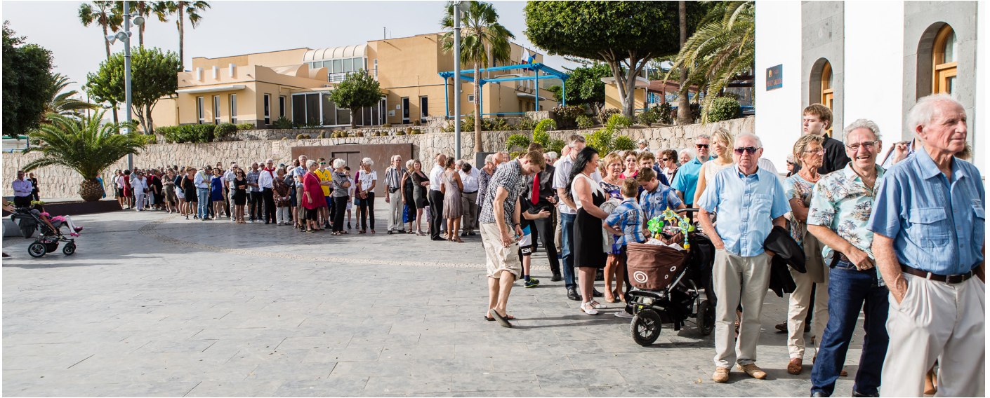
Flere hundre i kø for å gå til gudstjeneste på Gran Canaria.