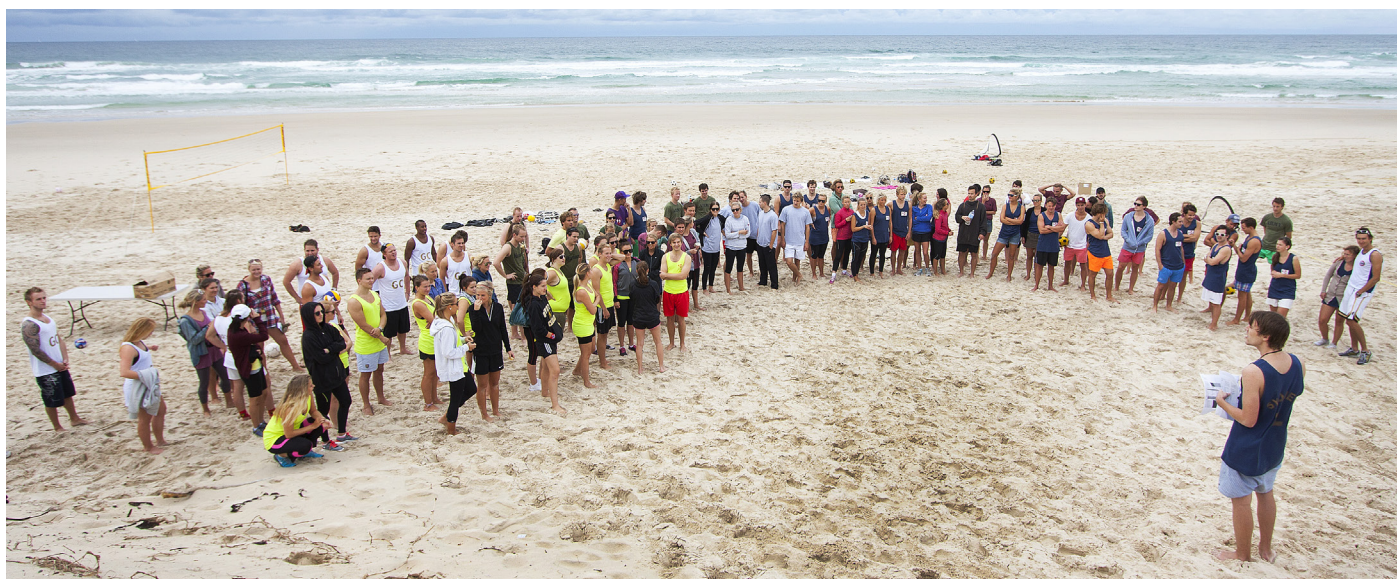
Norske studenter i Australia.

Sjømannskirken har 20 sjømannsprester som oppsøker norske miljøer rundt om i verden hvor det ikke er sjømannskirke. De ambulerende prestene er på reise for å møte mennesker der de jobber, bor eller oppholder seg - enten de er studenter, turister, fastboende, expats eller offshorearbeidere.