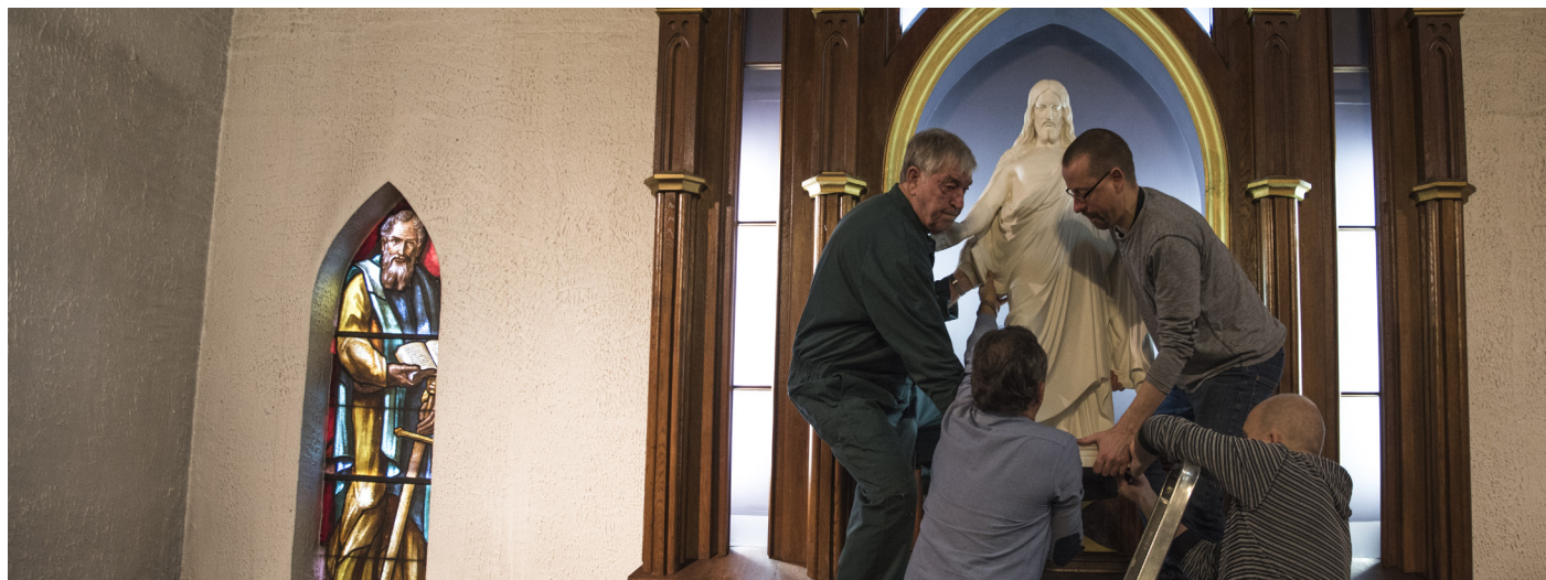
Kristus-statuen bæres ut av den gamle Sjømannskirken i Antwerpen.