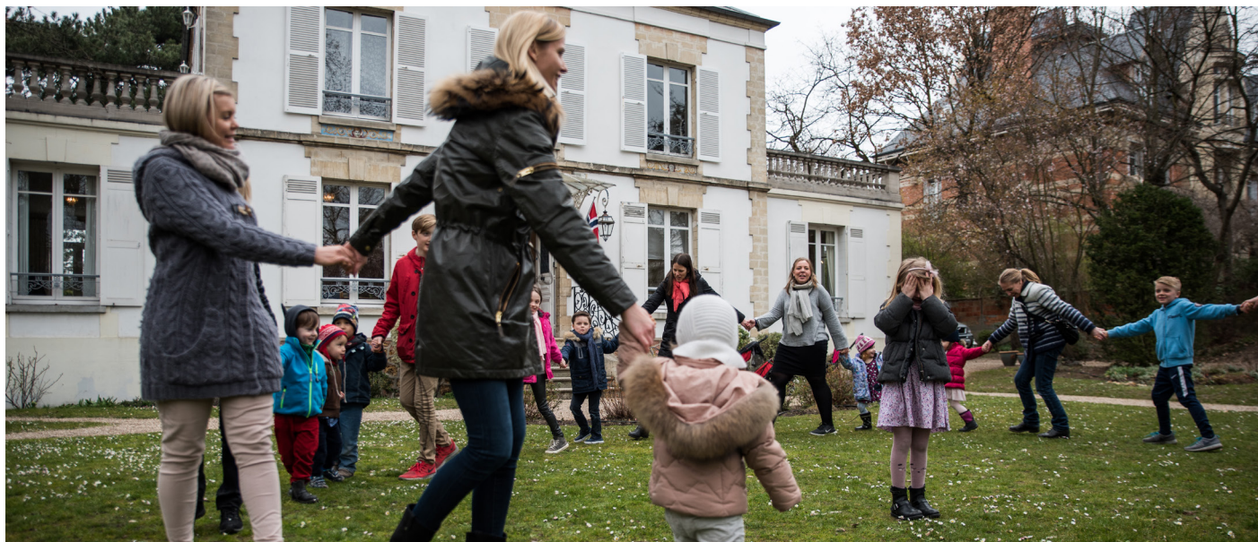
Barn og unge er et av fokusområdene i den nye strategien. Dette bildet er fra småbarnstreff ved Sjømannskirken i Paris.

Sjømannskirkens visjon om å være kirke i verdens hverdag og målet om å gi mennesker mot til tro, håp og engasjement skal oppnås gjennom å være en livsnær, oppsøkende og omsorgsfull kirke. Det er Sjømannskirkens tre kjennetegn som gir felles retning i mangfoldet.