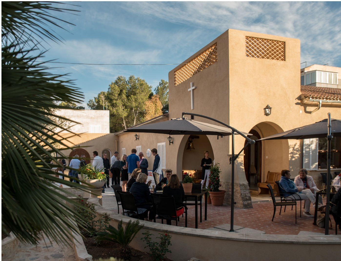
I 2016 fikk Sjømannskirken på Mallorca nytt kirkebygg.