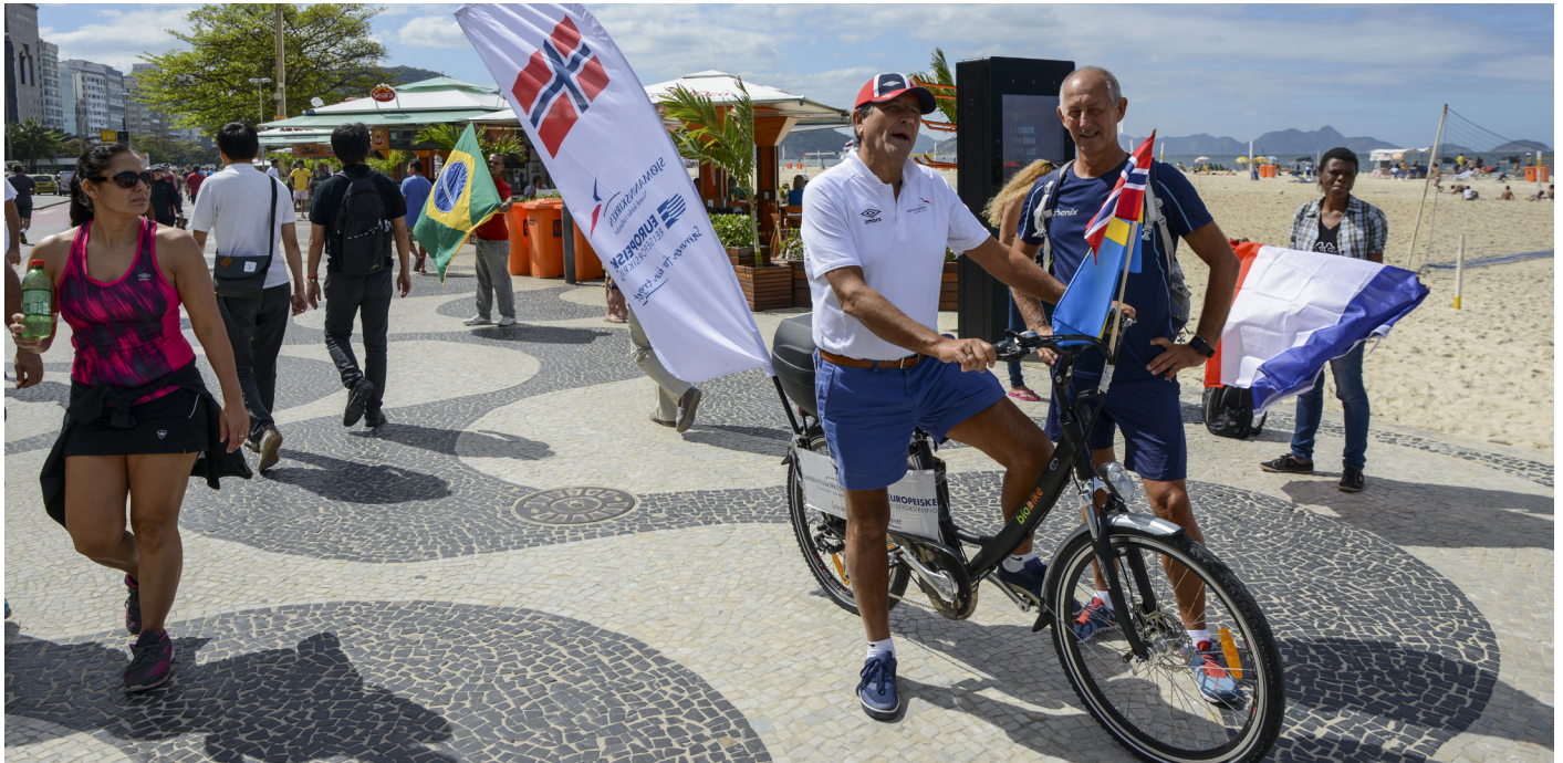
Utenlandssjef Asbjørn Vilkjensén på OL-sykkelen langs Copacabana Beach under OL i Brasil.