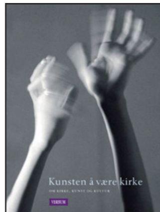
Kirkens kulturmelding "Kunsten å være kirke" (2005) følges nå opp ved at det bygges kompetanse på området både nasjonalt og regionalt.