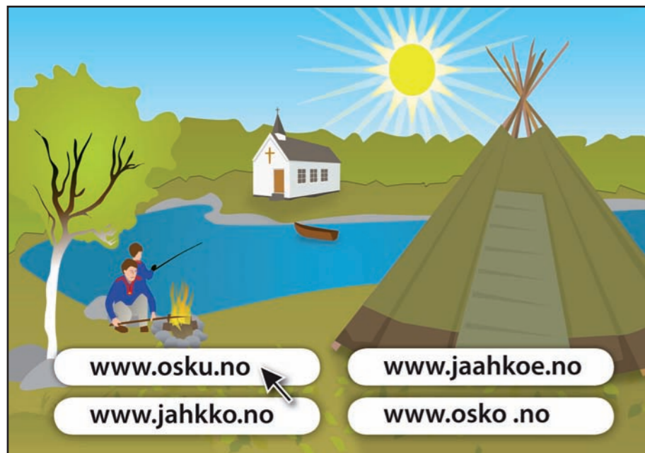
Arbeidet med et firespråklig samisk nettsted for trosopplæring, www.osko.no , stod sentralt for Samisk kirkeråd i 2008.

Forberedelsene til Samiske kirkedager i Enare i Finland sommeren 2009 har preget arbeidet i 2008. Kirkedagene samler samer fra Norge, Sverige, Finland og Russland. Det blir andre gang Samiske kirkedager arrangeres, første gang var i Jokkmokk i 2004.