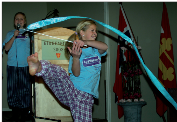
I 2008 hadde omlag 500 kirker fra Lindesnes til Nordkapp et LysVåken-arrangement. Mer enn 30 000 barn fikk invitasjon i posten, og omlag 10 000 deltok på den største kirkelige nyttårsfeiring i norsk historie.