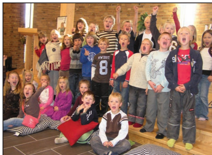
Sang- og musikklivet i kirkene utgjør også et omfattende kulturtilbud i lokalsamfunnene.