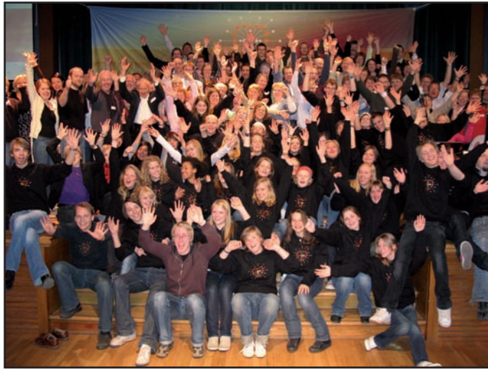
Fra en samling med prosjektmedarbeidere i oktober 2008.