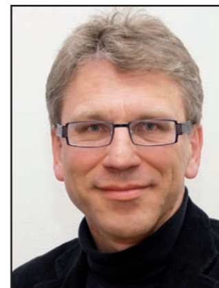
Generalsekretær Olav Fykse Tveit

I 15 år har vi arbeidet her hjemme med å bygge kontakt mellom kirken og muslimer på lederplan. Det har også åpnet dører for å få til møter mellom kristne og muslimer på lokalplanet. Det er både mulig og ønskelig å ha kontakt med våre muslimske medborgere. Det er nød-