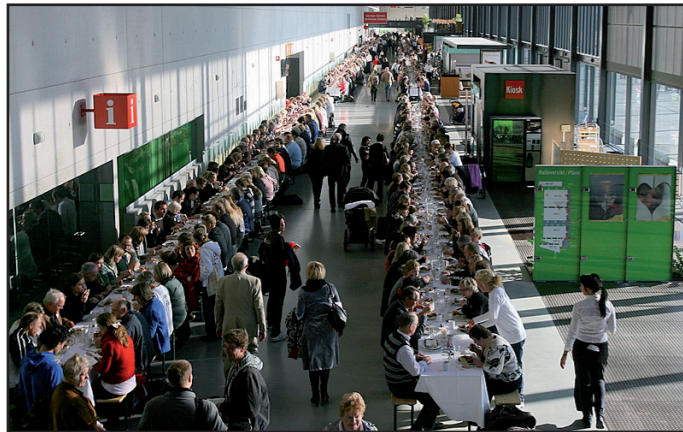
22. oktober 2008 var det dekket langbord til 1200 på Norges Varemesse under trosopplæringskonferansen.