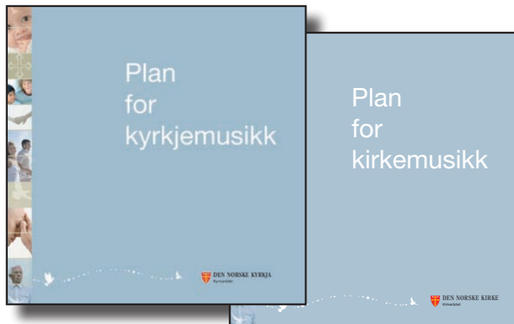
Plan for kirkemusikk ble vedtatt av Kirkemøtet i november 2008.