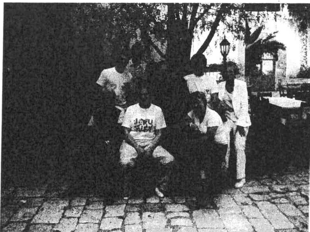
Grappa, samlet på St. Margareth, Nazareth

Som et kortere sammendrag vedr vennsksrelasjonen med ELCJHL anbefaler vi ressursarket til menighetene . (vedlagt)