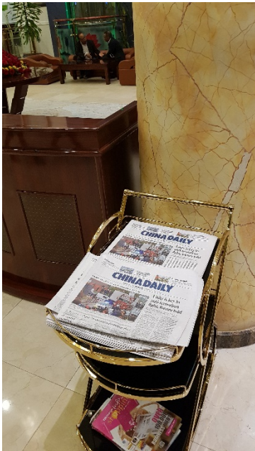
Resepsjonen på hotellet i Addis Ababa

Det blir spennende å se hva slags spørsmål som kommer fra Genève og hvordan høringsprosessen blir fram mot Polen 2023.