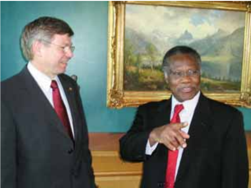
Tidligere statsminister Kjell Magne Bondevik og Generalsekretær i Kirkenes Verdensråd Sam Kobia.

Selv om imperiediskusjonen har skapt mye diskusjon, består det faktum at det er en følelse blant mange at vi har et system som er urettferdig og som skaper fattigdom. Denne følelsen og disse stemmene fra sør, synes vi det som en kirke i nord er viktig å anerkjenne. Samtidig er det oppfatning til komiteens flertall at begrepet "imperiet" og den måten å beskrive dagens globale økonomiske system som AGAPE gjør ikke er heldig for den økumeniske bevegelsens felles kamp for rettferdighet og mot fattigdom. Flertallet mener at det er behov for begreper som favner bredere og som forener kirker i nord og sør i denne kampen. Den relativt store enigheten rundt AGAPES "Call to Action" viser også det ikke er behov for å enes om dokumentets beskrivelse av det globale systemet for å kunne enes om handlingsalternativene. I den videre prosessen, blir det viktig å avklare hvor mye det er språket som skiller oss, og hvor det er reell politisk uenighet.