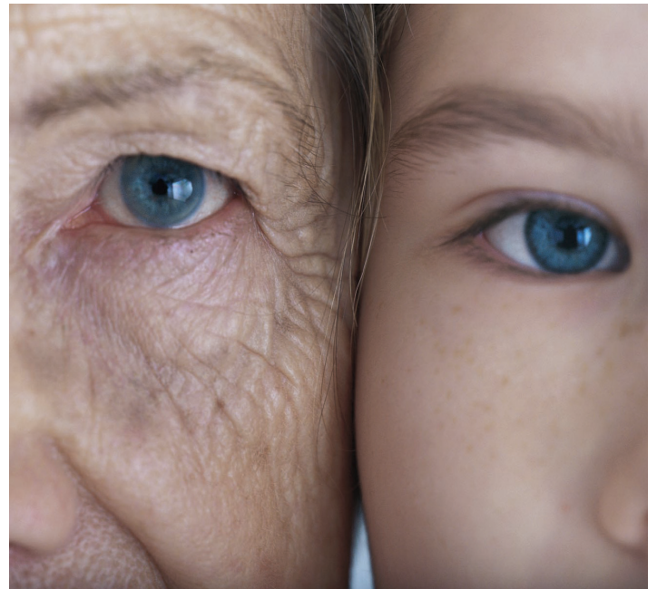
I et inkluderende fellesskap skal den enkelte både se og bli sett.

Kampen for rettferdighet innebærer å stille seg ved siden av medmennesket, ikke som passiv tilskuer, men i aktivt engasjement. Mennesket lever i og er avhengig av samfunnsmessige strukturer. Verdensomspennende systemer er med på å bestemme den enkeltes liv. Det er derfor nødvendig å klargjøre årsakene til menneskelig nød og lidelse, arbeide for å endre forhold som opprettholder nødtilstander og skape nye livsmuligheter. Å vise solidaritet er å ta opp kampen og arbeide for rettferdighet og fred.