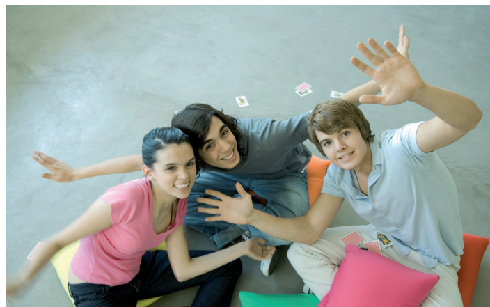
For unge mennesker er vennskap spesielt viktig.

Barn, unge, voksne og eldre kan trenge sine egne fellesskap. Samtidig må det legges til rette for fellesskap på tvers av generasjonene.