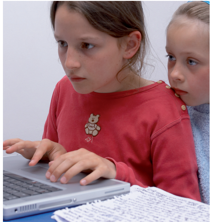
Mobbing av barn og unge skjer også via internett.

Å bekjempe vold betyr også å arbeide med holdninger. Det må drives forebyggende arbeid, blant annet ved aktivt å fremme alkoholfrie soner. Her kan det ligge til rette for lokalt samarbeid med politi, skole, uteseksjon, barnevern og familievern, bymisjon og andre organisasjoner.