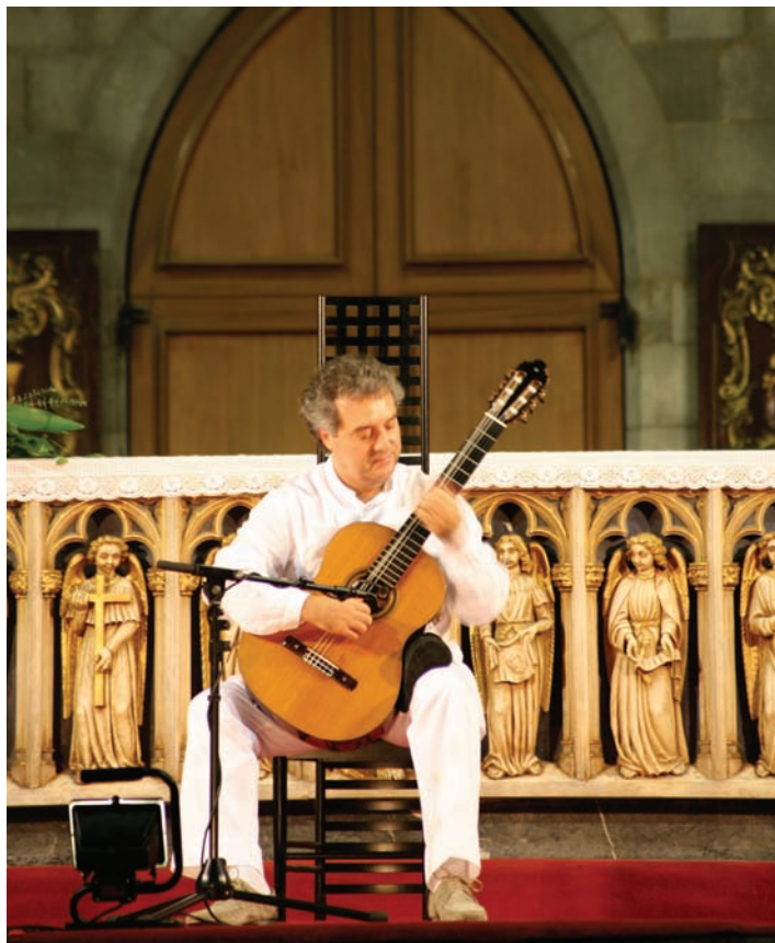
Kyrkjeromma er blant dei mest attraktive konsertlokala vi har.

Planmessig rekruttering av medarbeidarar til kyrkjemusikaryrket er ei stor utfordring for Den norske kyrkja. Kyrkja si kulturmelding tilrår ”... at alle landets