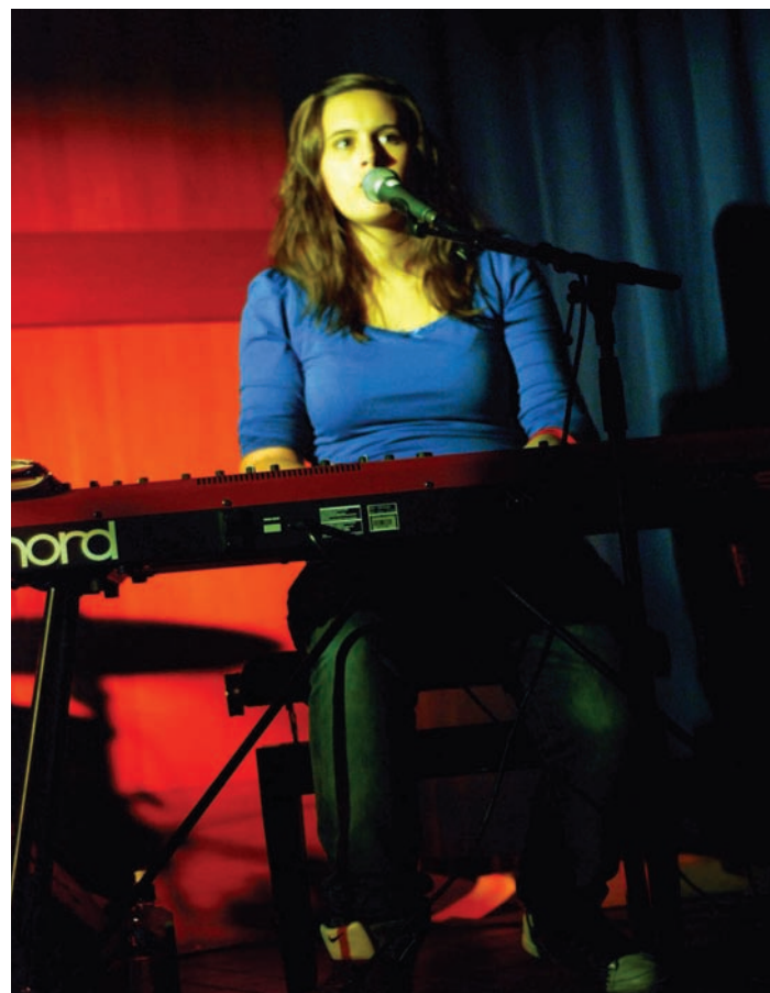
Musikk styrker fellesskapen mellom menneske i kyrkjelyden.

I musikken møter dei noko gjenkjenneleg, som ofte kommuniserer betre enn ord og tale.