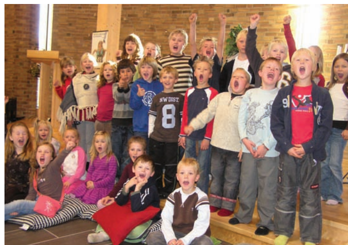
Korsongen er ei av dei største frivillige rørslene innanfor kyrkja.

I løpet av 1900-talet har fleire utviklingstrekk prega kyrkjemusikken: eit større mangfald i instrumentbruk,