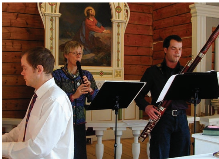
Vakkert samspel i kyrkja.