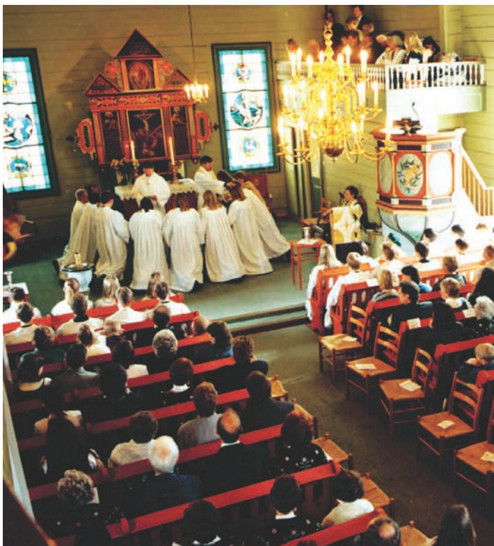
Musikk skapar møtestader for menneske i ulike fasar av livet.

I tillegg til dei kora som organisatorisk er ein del av verksemda til kyrkja, samarbeider kyrkjelyden òg naturleg med andre kor og musikarar i lokalmiljøet.