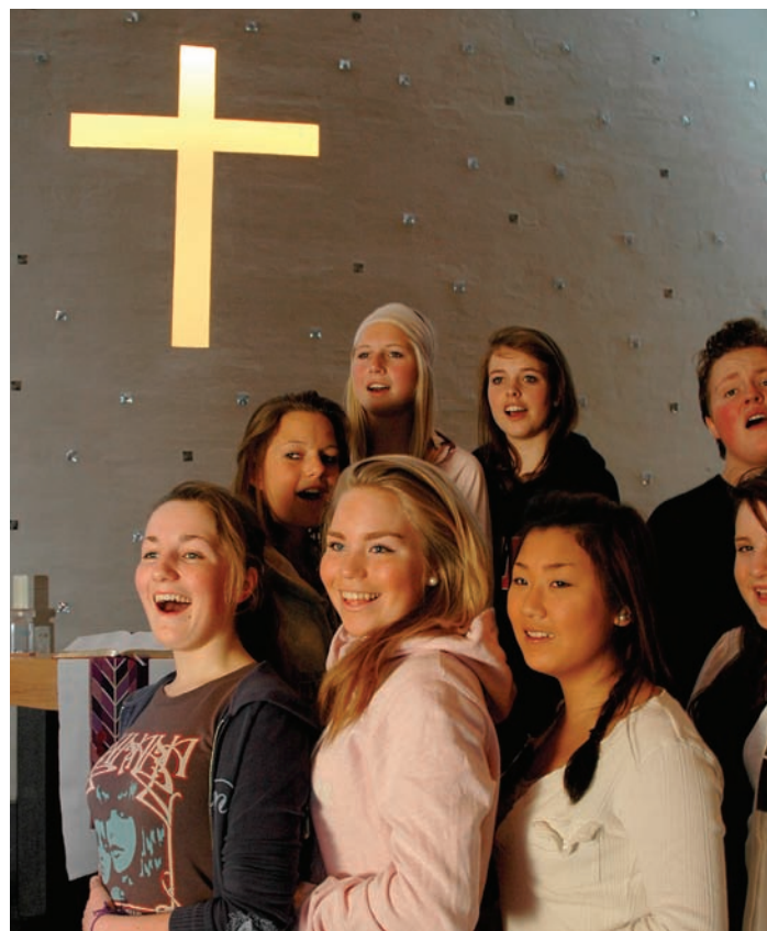
Korsong er eit kjerneområde i det kyrkjemusikalske livet i soknet.