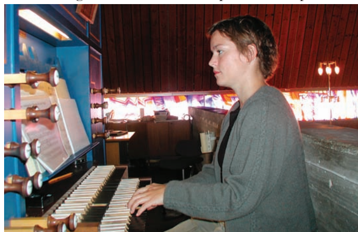
I tenesta si forvaltar kyrkjemusikaren beile det vide tilfanget av musikk som høyrer kyrkja til.

Koret er òg ein arena for sosial fellesskap og ei øving i samhandling. Korarbeidet er ein open fellesskap i den