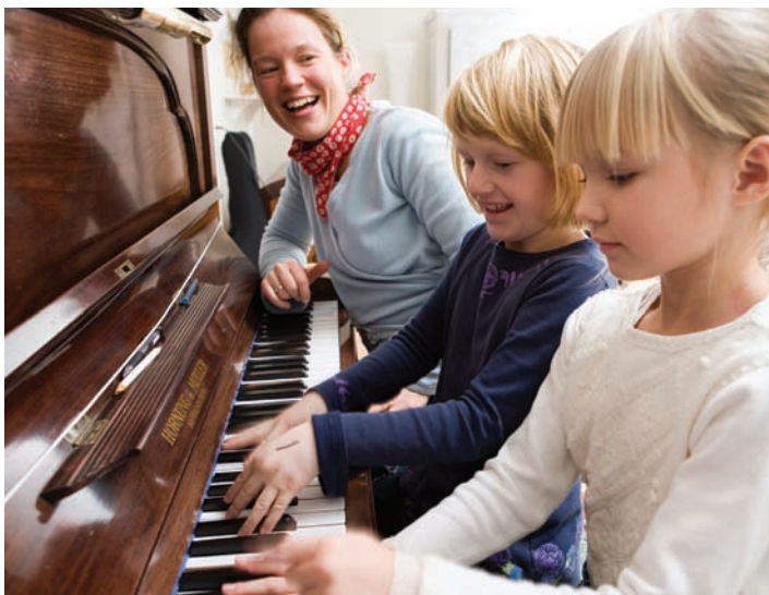
Korleis formidle songgleda og songskatten til barna og heimen?

Det er mange som er isolerte frå den kristne fellesskapen grunna alder, sjukdom eller