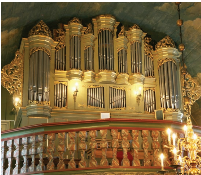
Lat barn og unge bruke kyrkjeorgelet til øving.

til rette for at kyrkjeorgelet kan brukast til øving også av barn og unge. Det er ein sterk motivasjonsfaktor at unge orgelspelarar får høve til å bruke orgelet i kyrkja og blir oppmuntra til å spele på konsertar og gudstenester. Kontakt med andre unge med den same interessa verkar òg motiverande. Regionale orgelklubbar og kurs for unge orgelspelarar er gode tiltak. Om ikkje dei unge orgelspelarane endar opp som kyrkjemusikarar, gir kontakten med orgelet og kyrkjemusikken ei eiga erfaring og eit spesielt forhold til kyrkja.