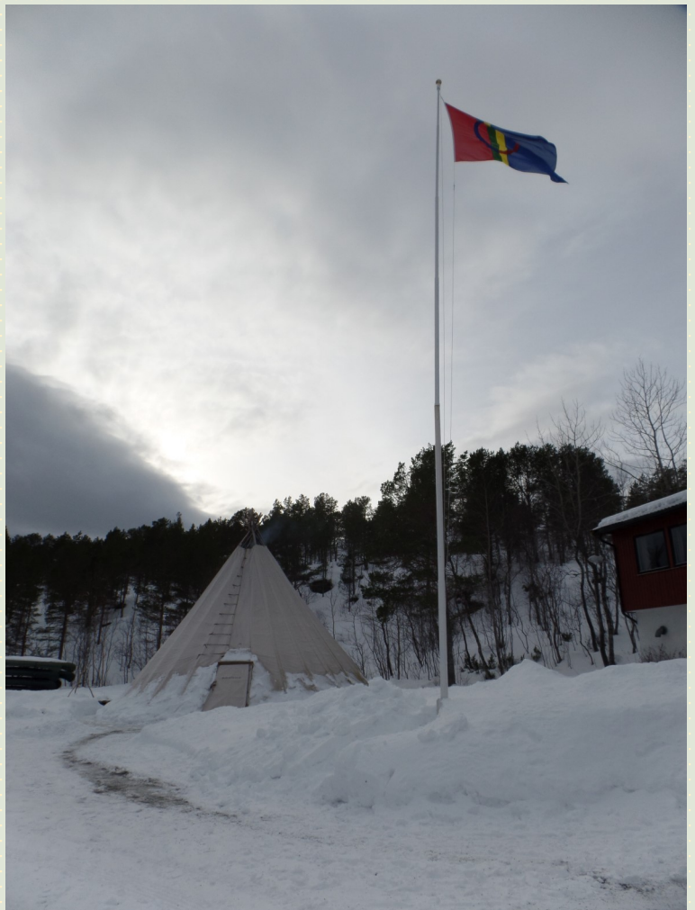
Det samiske flagget har stor symbolverdi for samer og andre. På samisk konfirmantleir i 2016 hadde leirstedet heist flagget for å ønske velkommen til stedet.

Det er flere minoritetsgrupper i Norge, men samene har som urfolk et særskilt vern, og kirka har et særlig ansvar for å skape likeverdig kirkeliv for det samiske folket, også for de samene som ikke snakker et av de samiske språkene.