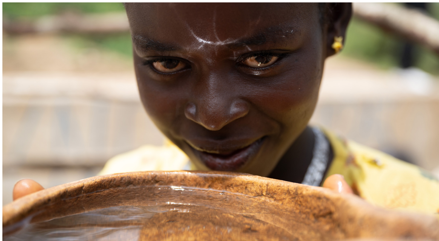
Endelig kan innbyggerne i landsbyen drikke rent vann. Det gir bedre helse, og jentene får mer tid til skole. Norske menigheters innsats i Kirkens Nødhjelps fasteaksjon er et viktig bidrag.

Religioner: Etiopisk-ortodoks kristendom, protestantisk kristendom, islam, lokale religioner.