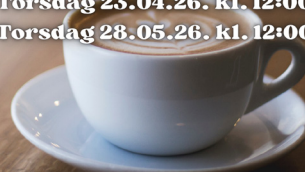
Hilsen Diakoniutvalget i Svinndal

Torsdag 26.02.26. kl. 12:00 Torsdag 26.03.26. kl. 12:00 Torsdag 23.04.26. kl. 12:00 Torsdag 28.05.26. kl. 12:00