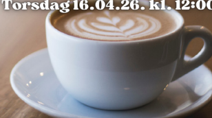
Hilsen Diakoniutvalget i Våler

Torsdag 12.02.26. kl. 12:00 Torsdag 12.03.26. kl. 12:00 Torsdag 16.04.26. kl. 12:00